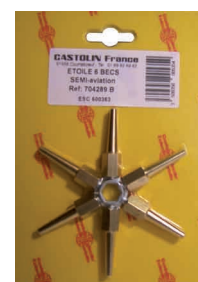
Etoile 6 becs Semi-Aviation Ref : 704289B