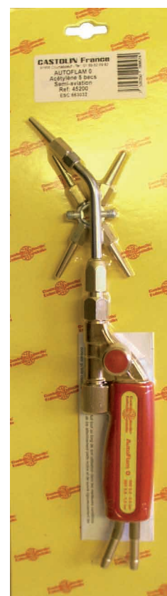
AutoFlam 0 Ref : 45200