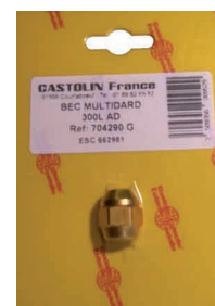
Bec Multidard Ref : 704290G